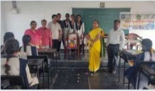
చోడవరం అక్టోబర్ 15, భారత్ వరల్డ్